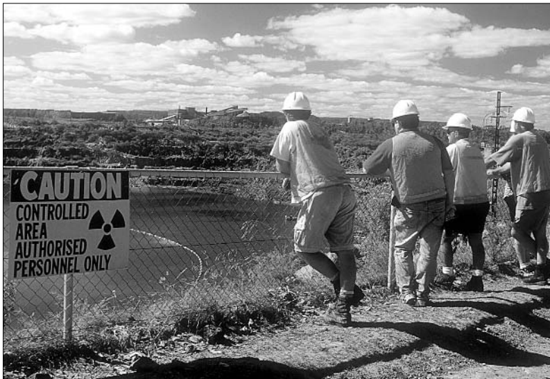
Mine d'uranium à Kakadu (Northern Territory)

Aujourd'hui, la volonté d'assimilation est bien morte, et fait place à une réelle politique d'autodétermination. Les Aborigènes font désormais face à un défi inattendu : gérer leurs succès et apprendre à maîtriser les techniques de gestion pour se prendre en mains. Des organisations indigènes telles que l'A.T.S.I.C. veillent à assurer le succès des revendications actuelles et aident les communautés redevenues maîtresses de leur terre à les faire fructifier. L'A.T.S.I.C. intervient également dans le financement et la mise en place d'une multitude de projets économiques, sociaux, éducatifs, etc. Reste à voir si ces organisations jouissant de budgets conséquents éviteront les pièges du clientélisme, du tribalisme et de la corruption.