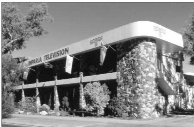
Locaux de la télévision aborigène à Alice Springs

Lorsque le parc national d'Ayers Rock fut institué, les Anangu peuplant la région se virent interdire la pratique d'allumer des feux de brousse, censés être nuisibles. Or ces feux allumés à la fin de la saison des pluies, lorsque