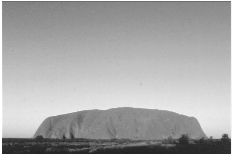
Uluru (Ayers Rock)

Avec un taux de chômage de 80% dans certaines communautés, la survie économique est une lutte quotidienne. Sous-qualifiés, et si différents qu'il est bien difficile