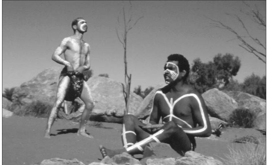
Danses traditionnelles à Alice Springs

de moins qu'un Australien blanc. Le taux de mortalité infantile est comparable à celui des pays du tiers-monde. Une majorité d'Aborigènes vit aujourd'hui en milieu urbain. Il peut s'agir de simples bourgades où se côtoient mineurs et cow-boys, ou de mégapoles comptant plusieurs millions d'habitants. Conséquence tant de leur manque de moyens financiers que du rejet dont il font